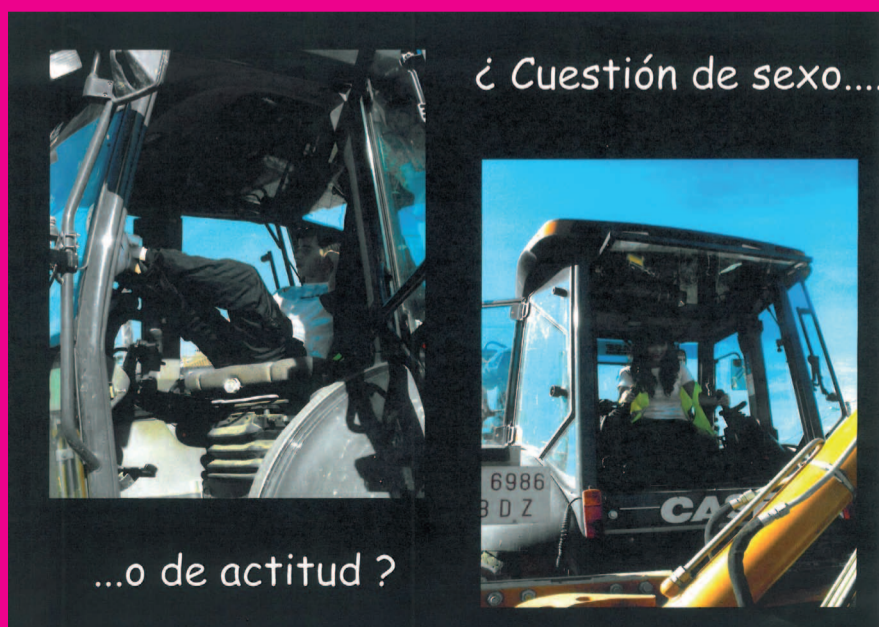
3º Premio del II Concurso de Fotografía "No te quedes fuera, que no te excluyan"