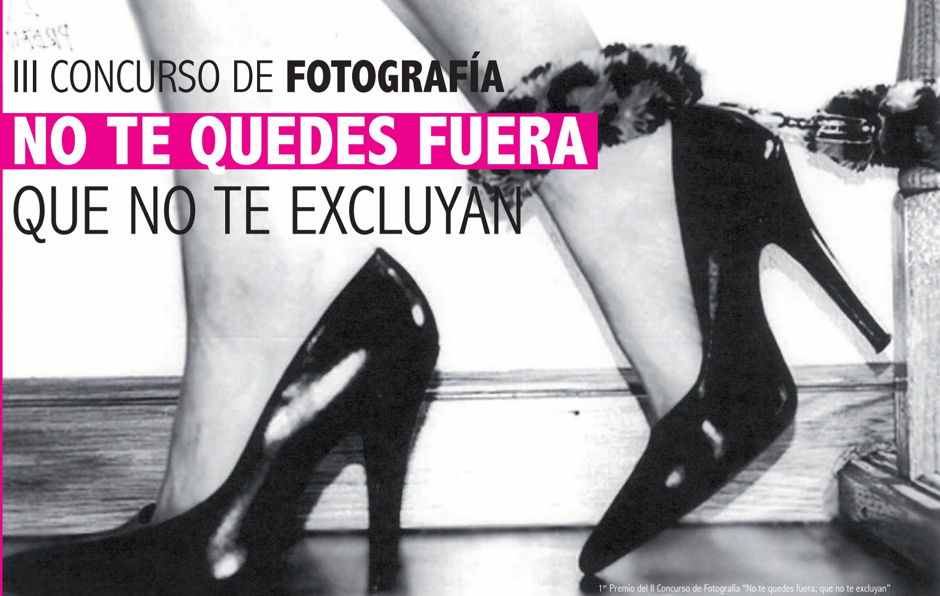
1º Premio del II Concurso de Fotografía "No te quedes fuera, que no te excluyan"